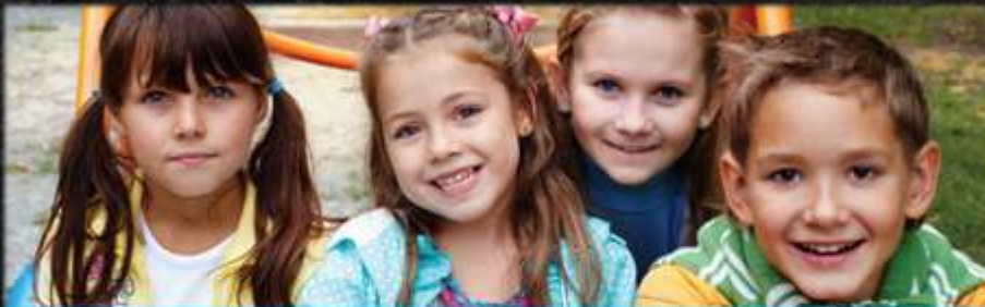
פשוט לשמור על הילדים